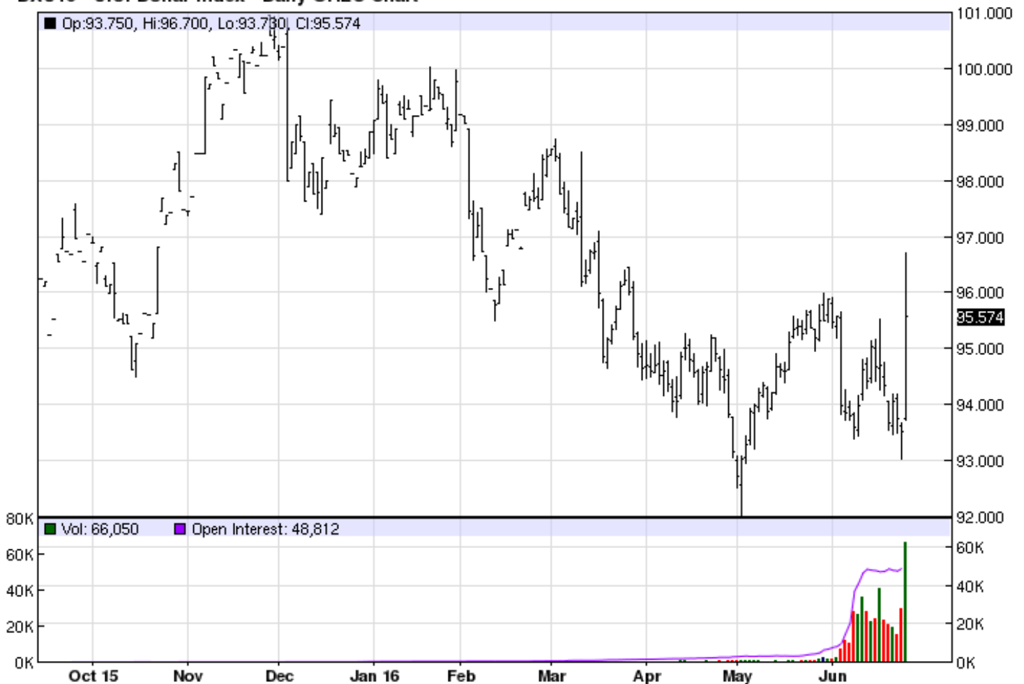
DXU16 - U.S. Dollar Index - Daily OHLC Chart

95.574s ▲ +2.047 (+2.19%) 3:59P CDT (ICEUS) -