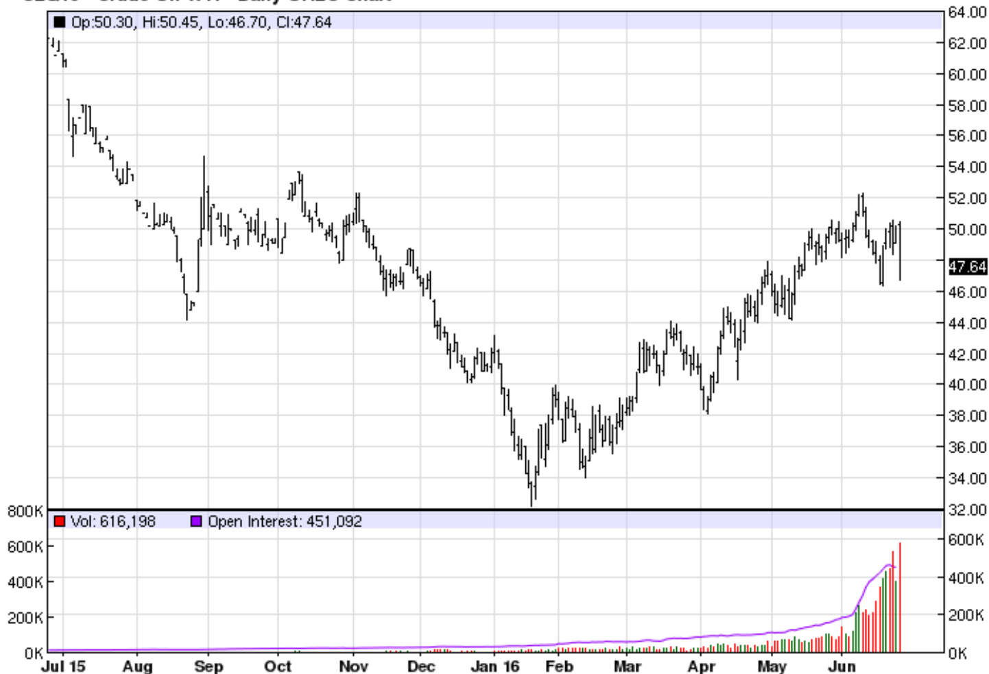
CLQ16 - Crude Oil WTI - Daily OHLC Chart

Como se puede observar los mercados no son ajenos a los avatares políticos.